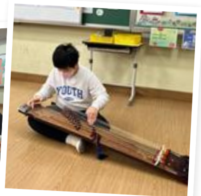
☆ 학급 발표회