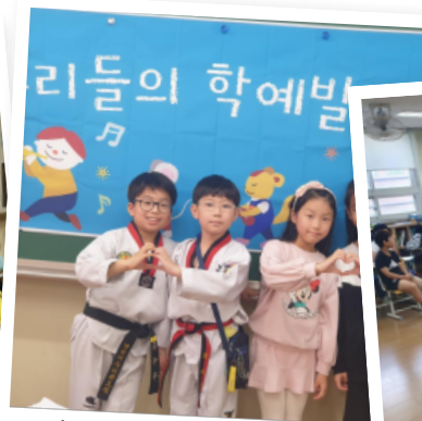
☆ 학급 발표회