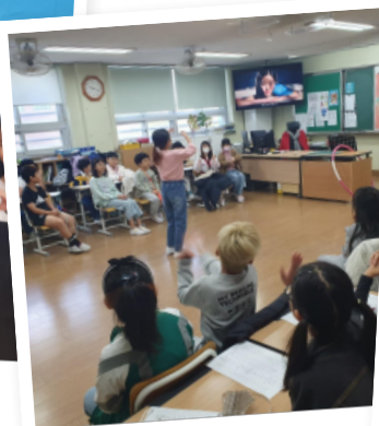
☆ 학급 발표회