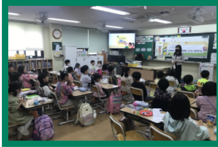
우리들의 보물찾기 의형제 맺기