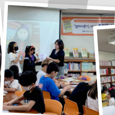
☆ 작가와의 만남