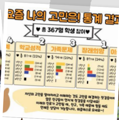
☆ 나의 고민은?