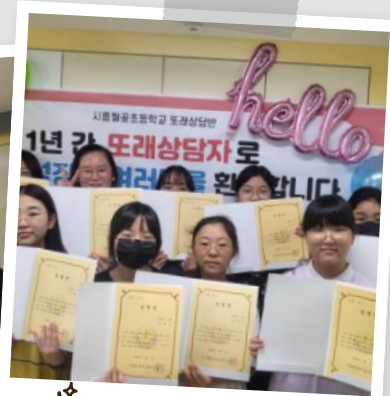
☆ 또래상담 활동