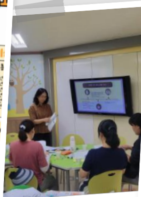
☆ 보호자 양육교육