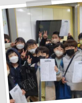
☆ 학교폭력예방 캠페인