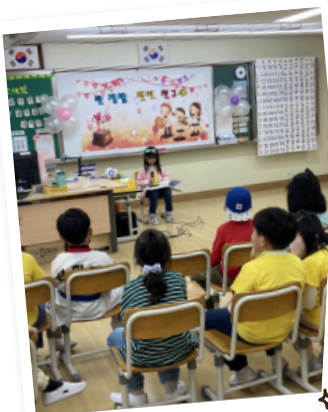
☆ 학급 발표회