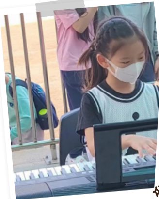
☆ 퍼스킹 공연