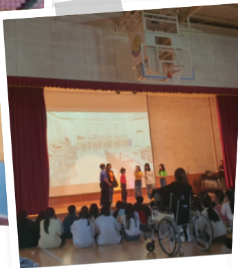
☆ 연극 동아리 발표회