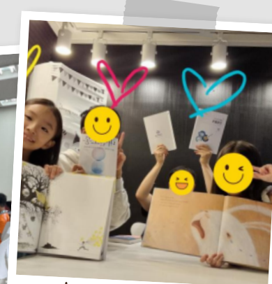
☆ 독서의달 행사