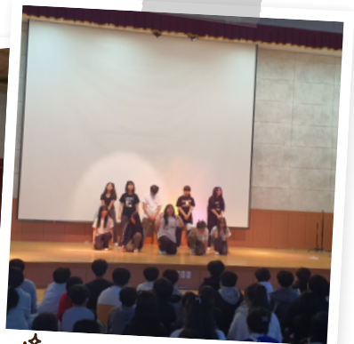
☆ 댄스 동아리 발표회